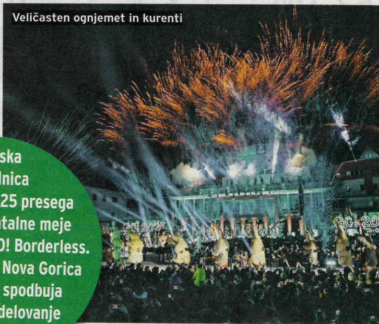
Veličasten ognjemet in kurenti

Evropska prestolnica kulture GO!2025 presega fizične in mentalne meje pod sloganom GO! Borderless. Povezuje mesti Nova Gorica in Gorica ter spodbuja čezmejno sodelovanje in življenje.