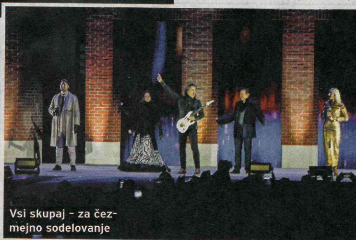
Vsi skupaj – za čez- mejno sodelovanje

Uradni slovesnosti je sledil vrhunec odprtja EPK, umetniški spektakel svetlobe, zvoka in gibanja na Trgu Edvarda Kardelja v Novi Go-