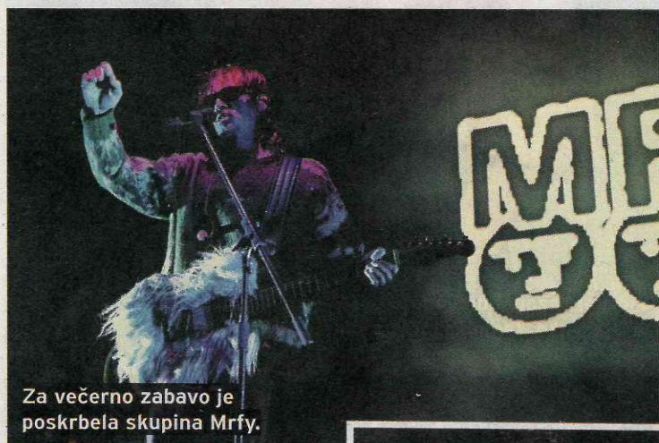
Za večerno zabavo je poskrbela skupina Mrfy.

Veliki dan za Slovenijo in Novo Gorico, ki je skupaj z Gorico 8. februarja pod sloganom GO! Borderless postala Evropska prestolnica kulture (EPK). Prvič v zgodovini eno prestolnico kulture predstavljata dve mesti iz dveh držav, ki ju povezuje močna zgodba povezovanja.