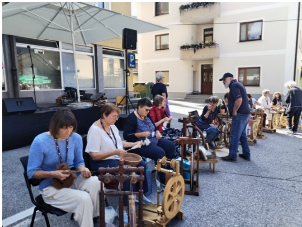
Predice na delu

Festival v središču Cerknega je ponudil vse te dobrote, ob tem pa tudi druge lokalne jedi, prehrabnene izdelke ter rokodelsko ponudbo domačih ustvarjalcev. Prav imeniten dogodek, ki je organizatorjem dobro uspel. Vzdušje velikega števila obiskovalcev ste lahko poslušalci Primorskega vala spremljali v neposrednih javljanjih naših mladih novinark