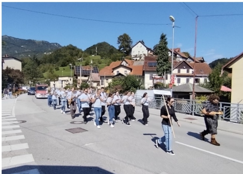
Prizor s cerkljanskih ulic

Kulinarični in etnološki dogodek se je čez dan pretil v tradicionalni Pihnfest, ki ga več let organizira Godbeno društvo Cerčno. Domači in trije gostujoči orkestri so popoldne popestrili cerkljanske ulice, po 16. uri pa je zvesta publika lahko prisluhnila skupnemu nastopu. Letošnjega Pihnfesta so se poleg cerkljanek godbe udeležili Pihalni orkester Tolmin, Pihalni Orkester Škofja Loka in Nuova Banda Di Carlino iz Italije.